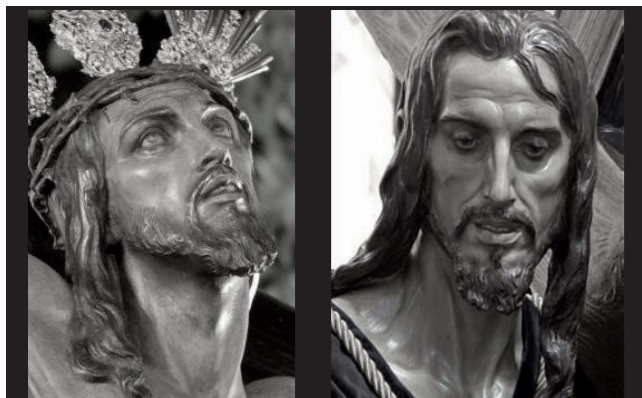
Cristo de la Expiración, 1940

Tiene la muestra su punto culmen en las Salas Expositivas del Rectorado, para finalizar en el Museo del Patrimonio Municipal, donde está expuesta de manera permanente una Alegoría que formó parte del monumento al Marqués de Larios.